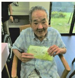
社協様より 記念品