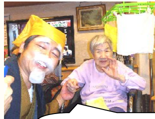
水戸黄門「助さん角さん やってしまいなさい!!」