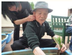
5月6日 田植え 田植えって気持ちいいね