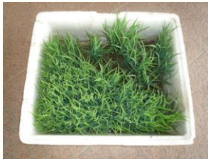
← 苗です 手でちぎって植えて行きます