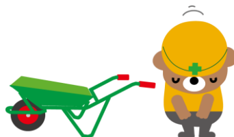
ご迷惑をおかけして申し訳ありません