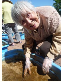
5月4日 しろかき作業