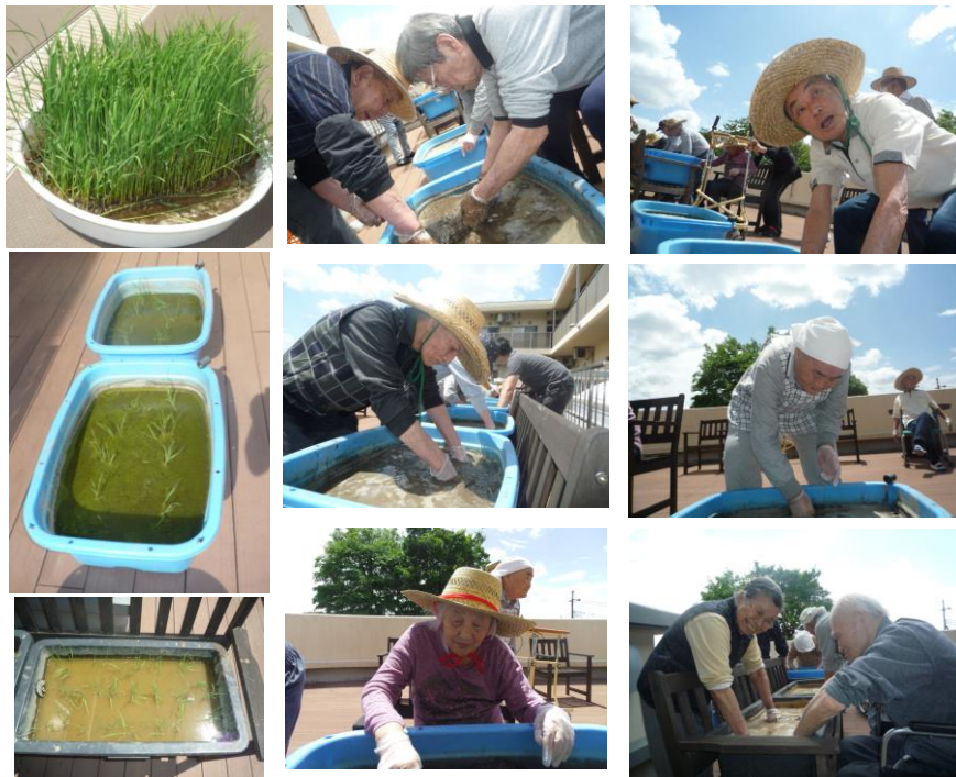
5月4日 しろかき作業

イネ持つて「気持ちいいねー」 いよいよ始まりました、稲作。これが始 まると、ひなの杜の一年がスタートしたと 実感してしまいます。 今は弱々しいイネですが、暑い夏を乗越 える頃には立派になっていいると思います。 イネに負けないくらい元気に楽しく過 ごせたらと思います。 当日は大変お天気も良く、作業はとても 楽しく、気持ちよくなりました。